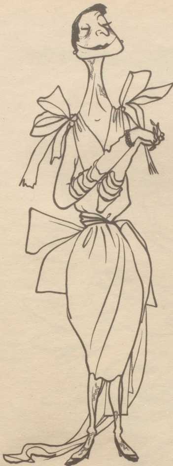
Altes modisches Vollblut