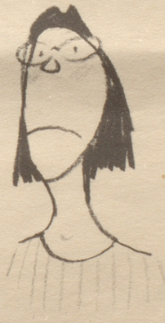
«En Ärmelschurz isch jedefalls s Aschtändigstcht!»

Nachschrift: Von mir nicht bemerkt hat meine Frau den Fragebrief mitgelesen und flüstert mir über die Achsel (mit Trägern!) zu: «Fischbein, Lieber, Fischbeinstäbchen!» — womit obige Anfrage keiner Antwort bedarf.