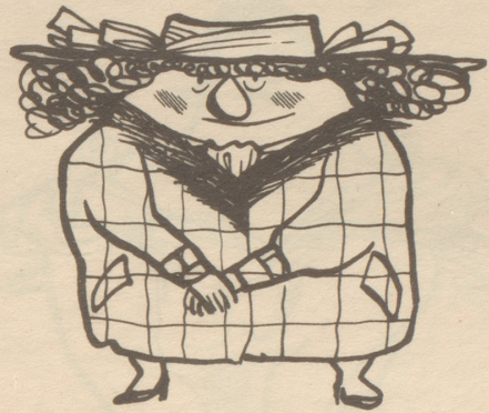
für niedrigen Kopf