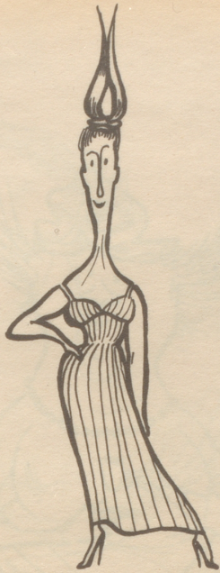
für hohen Kopf