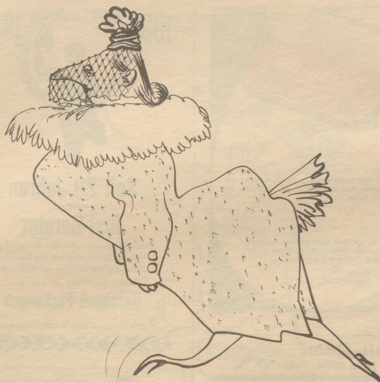
Die Haltung für 1951

Plötzlich kommt es wie eine unerklärliche Raserei über ihn! Sein Auge blitzt, hart preßt er die Lippen zusammen, und sein Gesichtsausdruck wird grausam. Mir wird heiß. Was will er? Langsam, ge-