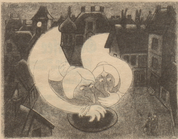
Kleinstadtleben Söndagsnisse Strix