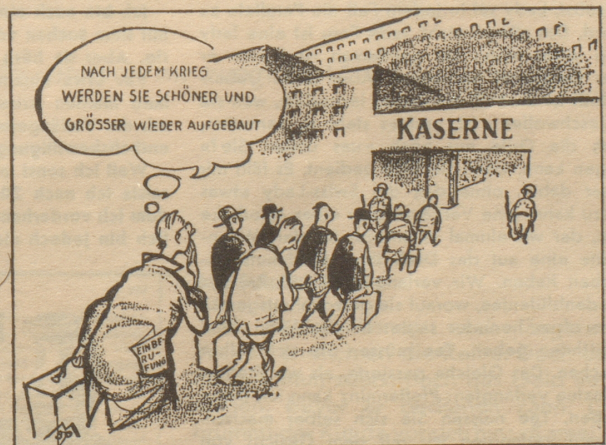
Europäischer Wiederaufbau Stockholm Tidningen