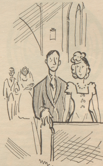
«Horch, Georg, sie spielen unsere Melodie!» Copyright by Punch