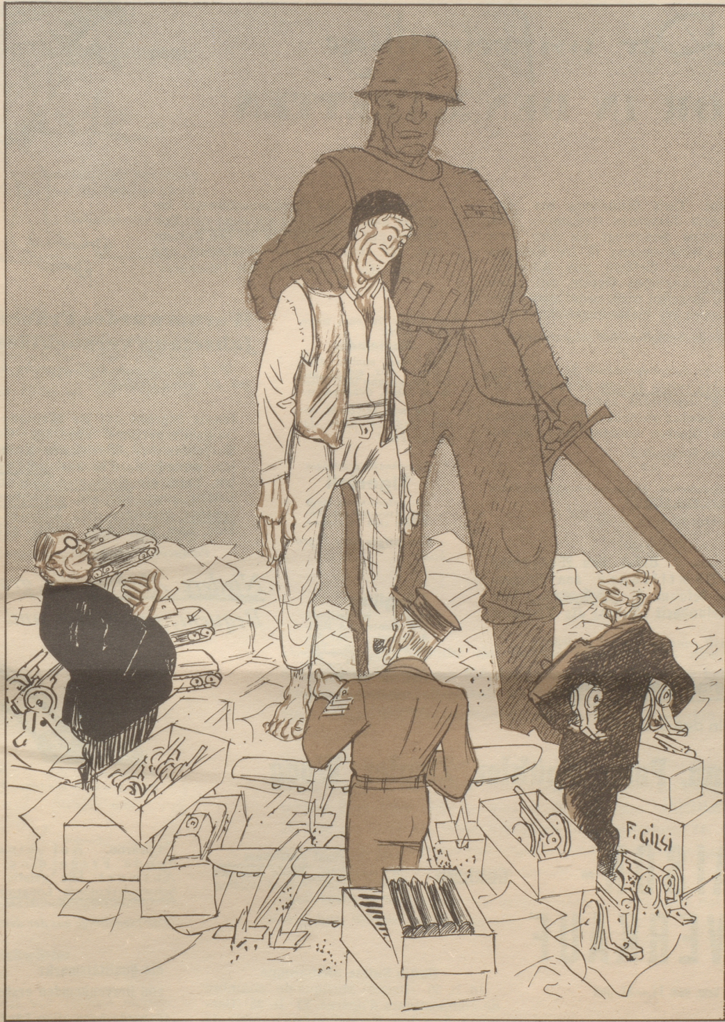
Michel als Partner?