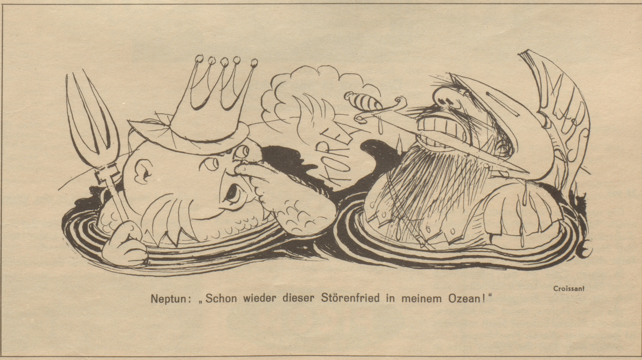
Neptun: „Schon wieder dieser Störenfried in meinem Ozean!“

bald seltene Tugend; 19 ähnlich dem Pinscher; 20 ??; 21 ??; 22 wird kiloweise gelutscht in den Hundstagen; 23 Städtchen am Sempachersee mit früherem Habsburger Kloster; 24 Panzerechse; 25 das Tessiner Jawort; 26 Weckergeräusch; 27 spanischer männlicher Vorname; 28 das erste war süß!