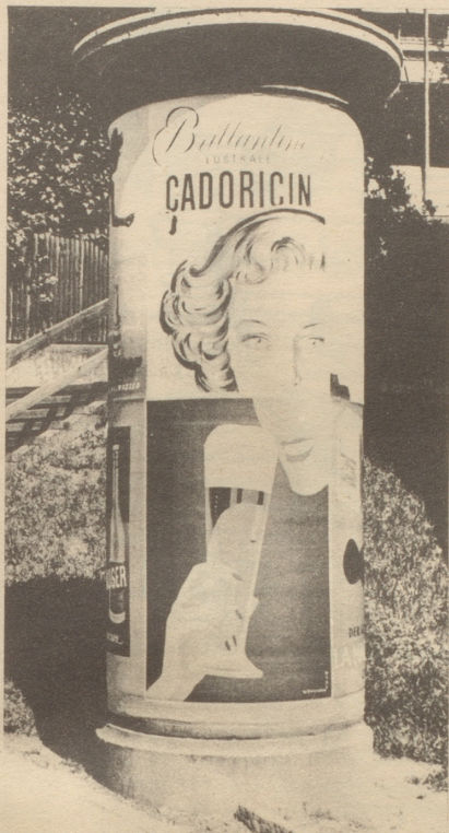
Plakatsäule im Hochsommer