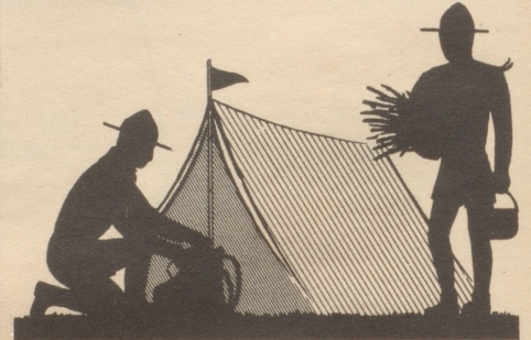
FABRIKANT: WEICHKÄSEREI USTER

zum Picknick, auf Touren HEIDI Rahm, Emmentaler, Assortiert, Schinken, Kräuter, Streichkäse