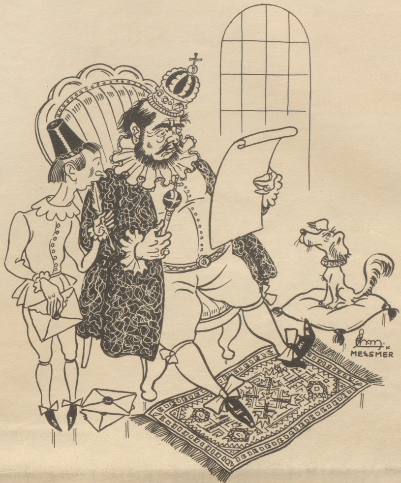
Protestnote in der guten alten Zeit

«Und weigern Sie sich weiterhin, mir auf direktem Wege eine Buße von hundert Fran-