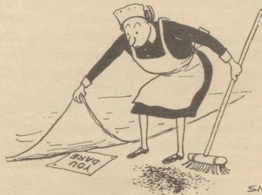
Sie dürfen ...

Soll ich nun, oder soll ich nicht? Trudy