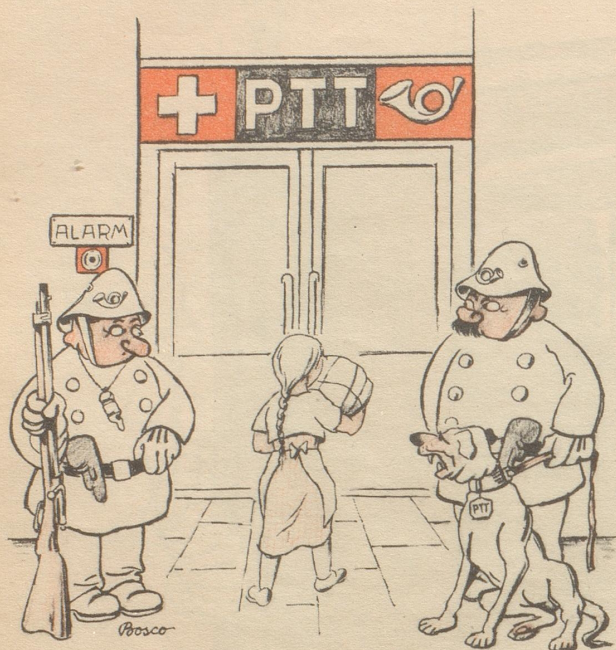
Bewaffnete Pöschtlter, ein Gebot der Stundel

380 gesammelte Zeichnungen aus dem Nebelspalter von Carl Böckli und seinen Mitarbeitern aus der Zeit des roten und braunen Terrors: