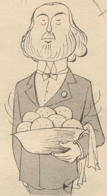
Der Ober von Ammergau