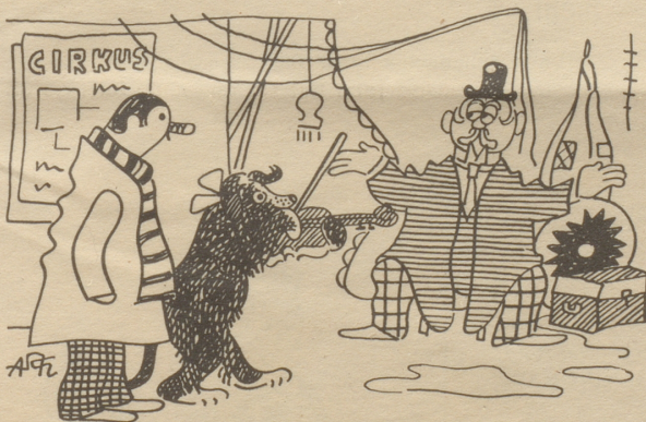
Der Direktor: „Ja, ja, aber wer will schon klassische Musik hören?“ Söndagsnisse-Strix