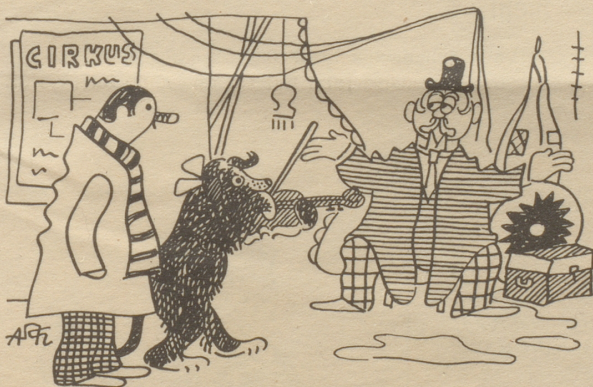
Der Direktor: „Ja, ja, aber wer will schon klassische Musik hören?“ Söndagsnisse-Strix