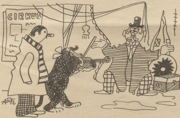
Der Direktor: „Ja, ja, aber wer will schon klassische Musik hören?“ Söndagsnisse-Strix