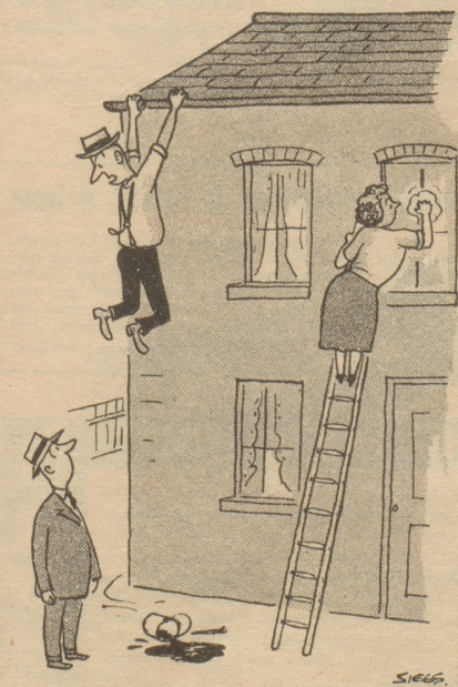
«Wenn ihr etwas in den Sinn kommt, muß es sofort getan werden!»

Himmelhoch jauchzend, zu Tode betrübt! Ich gestehe, daß mir Tränen der Rührung in den Augen standen. War das eine schöne Zeit, vor vielen Jahren. (Ich bin nun vierundzwanzig.) Des lieben Petrus Vorrat war erschöpft und ich konnte meinen Weg fortsetzen. Daß ich dabei mit wachen Augen träumte, kann mir niemand übel nehmen. So lange die Liebe blüht, ist das Leben immer noch lebenswert. Oh, ich begann zu fantasieren und weil mein Herz sang, sangen auch meine Lippen. Die lieben Dörfler konnten nicht begrei-