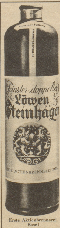
Erste Aktienbrennerei Basel