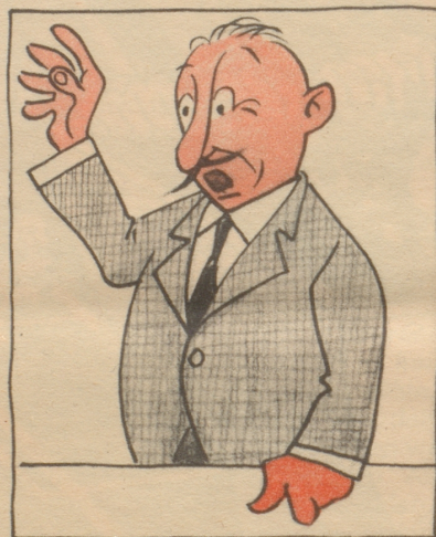
1958. Da die Ausgaben der PTT nicht mehr abgebaut werden können durch Sistierung einer Postaustragung, müssen die Tarife erhöht werden.