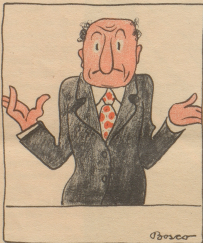
1954. Um weitere Tariferhöhungen vermeiden zu können, muß in Zukunft die Postaustragung wefallen.