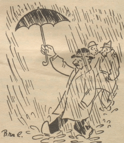
Johannsson hat geheiratet!