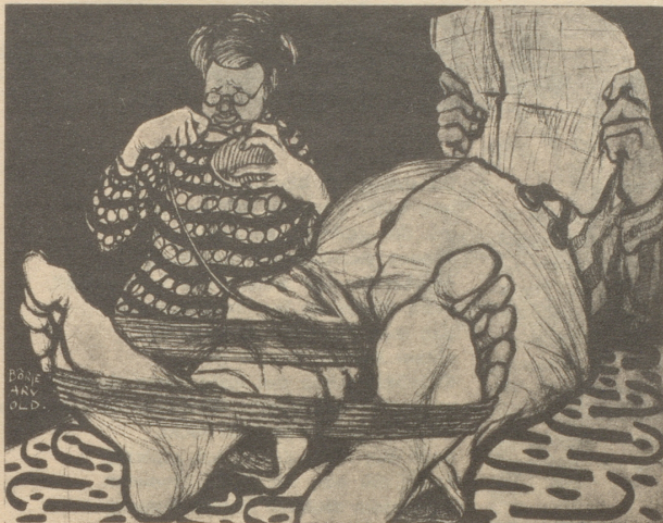
Die vollkommene Ehe.