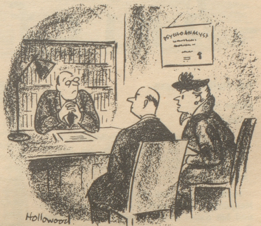
« Herr Professor, wir wollen wissen, wer von uns den Minderwertigkeitskomplex hat. »