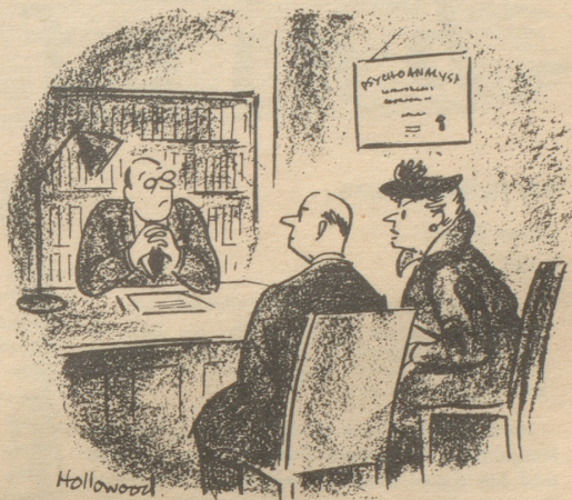
« Herr Professor, wir wollen wissen, wer von uns den Minderwertigkeitskomplex hat. »