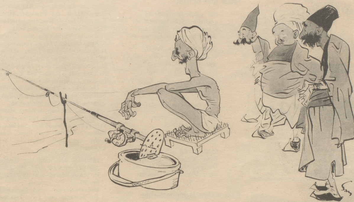
Fakir auf Urlaub