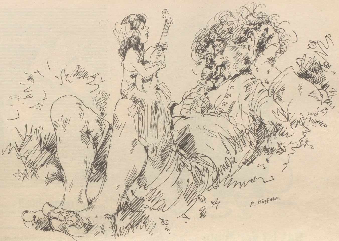
Der zartbesaitete Riese