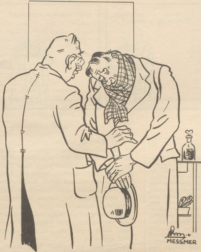
„Wo hänzi sich dann die Halscheerl gholet Herr Schtünzi?“ „Im Kunschthuus, i dr abschtrakte Uusschtelig.“