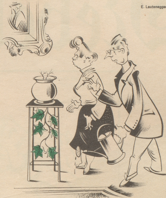
Scho wider de Setzlig vercheert ligschteckt!