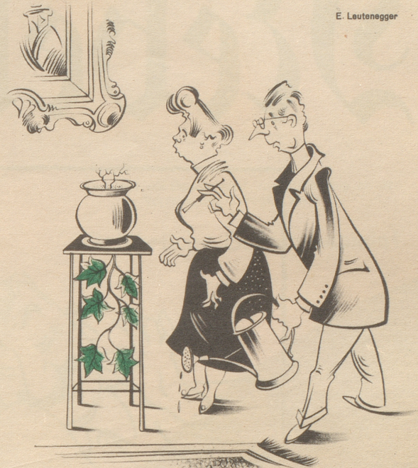
Scho wider de Setzlig vercheert ligschteckt!