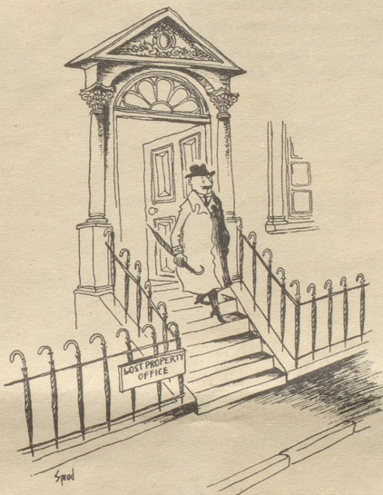
Das Fundbüro Copyright by Punch