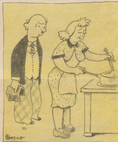
Der Frühling naht, man spürt's in allen Knochen. Es gibt jetzt Fleisch, Gemüs, Salat und Knollen; Nun kann die Hausfrau wieder fröhlich kochen, Vorausgesetzt ihr Mann gibt ihr den Bollen.