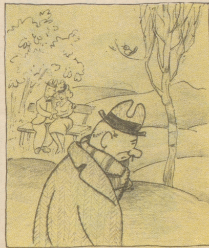
Der Frühling naht, die Vögelin singen wieder, Radieschen kann man auch bald wieder rupfen; Am Abend sitzt zu Zweit man unterm Flieder. Und holt sich wie alljährlich einen Schnupfen.