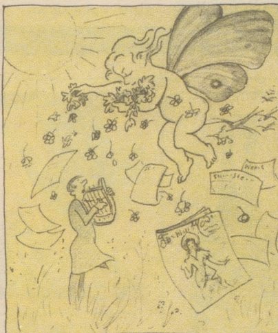
Der Frühling naht, der Dichter greift zur Leier, Die Frau zu Frühjahrskleidchenkatalogen; Die Hühner legen wieder frische Eier, Und Steuerzettel kommen angefliegen.