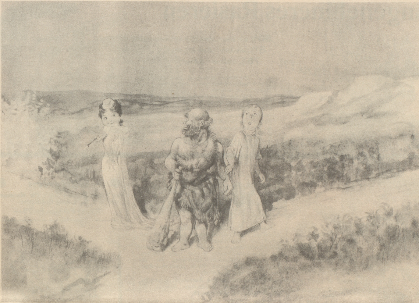
Herkules am Scheideweg