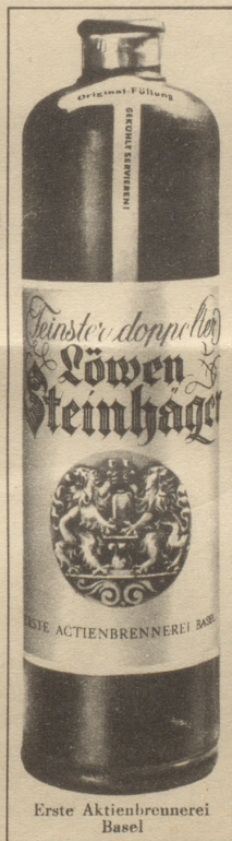
Erste Aktienbrennerei Basel

Asthmacidin Heilmittel gegen alle Formen von Asthma, Herzschwäche u. chron. Bronchitis. In Apotheke. Hersteller: St. Amrein, pharm. Spez. Heiden, Tel. 204