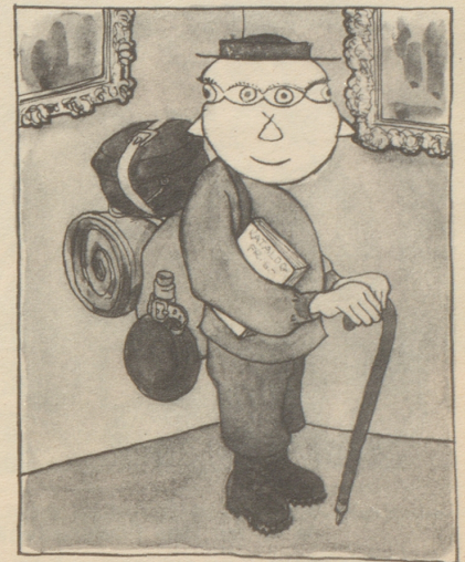
Dem Geruhsamen: Augen rundum, Rucksack, Zelt und Kochtopf ...

fassung. Andererseits: pro Jahr gibt es nur einen Winter, und der sollte doch neben der Kohlenrechnung und dem traditionellen Bronchialkatarrh noch eine positive Seite haben. Selbst für einen seriösen Familienvater.