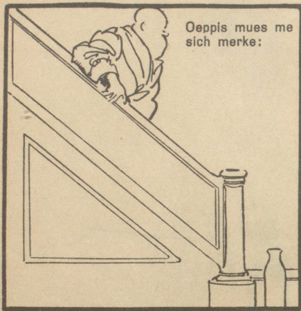
Oeppis mues me sich merke: