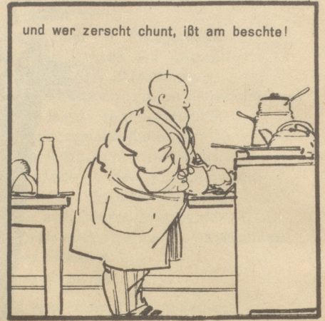
und wer zerscht chunt, ißt am beschte!