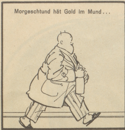
Morgeschlund hät Gold im Mund...