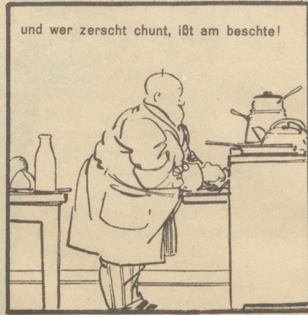
und wer zerscht chunt, ißt am beschte!