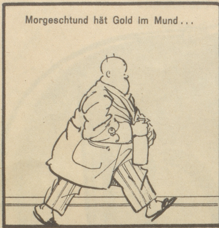
Morgeschund hät Gold im Mund...