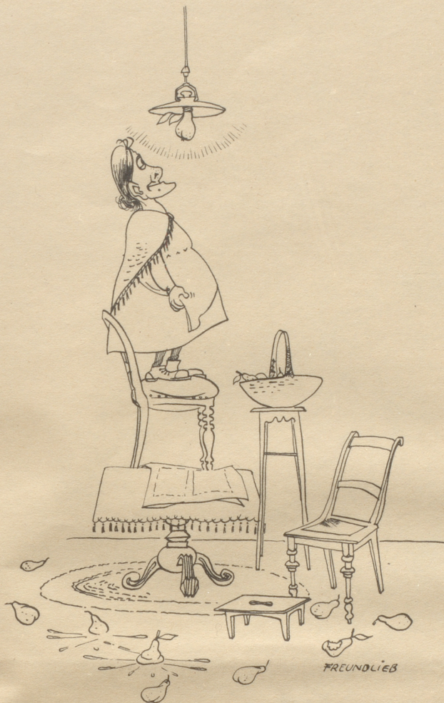
Endlich eine gute!