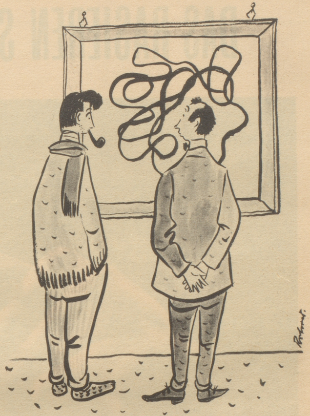
«Hät das öppis mit Politik ztue?»