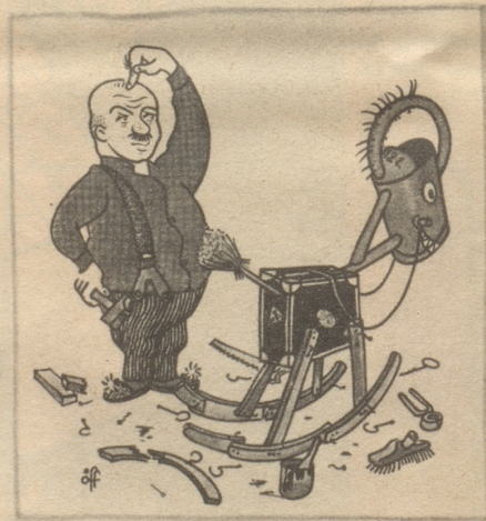
Die Axt im Haus erspart das Chrishchindli

Was willst du mehr? hüben wie drüben wirst du stark gefeiert, und wenn dir das trotz deines hohen Alters zu anstrengend wird, so nimm deinen Divan und ruhe sanft auf beiden Seiten.»