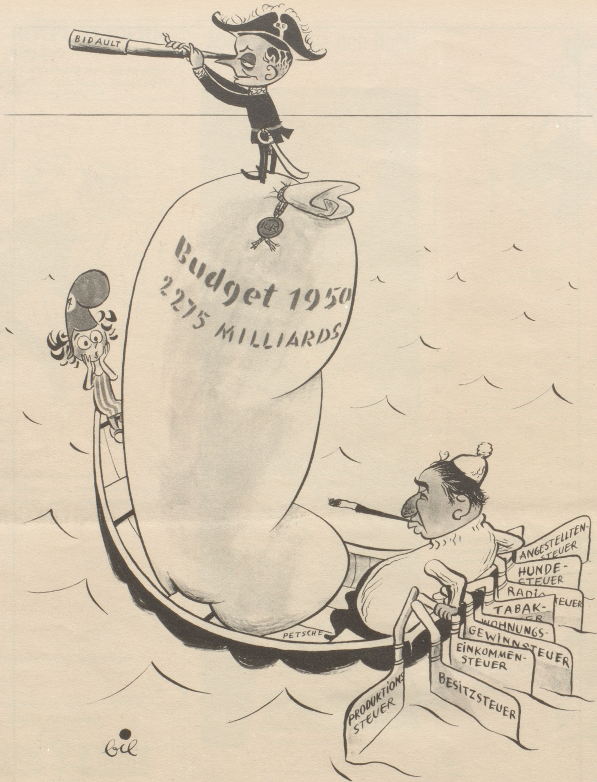
Mariannes unbeliebter Steuer-Mann