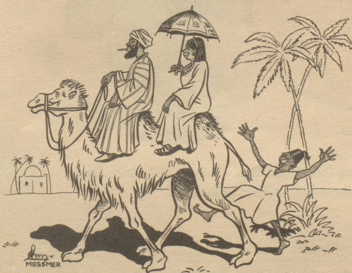
Tandem in Afrika

Unverlangt eingesandte Text-Beiträge werden nur dann zurückgesandt, wenn denselben ein frankiertes und adressiertes Couvert beiliegt Textredaktion.