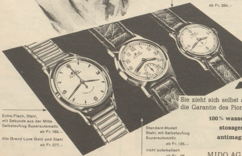
Extra-Flach, Stahl, mit Sekunde aus der Mitte Selbstaufzug Superautomatic ab Fr. 189.— dito Grand Luxe Gold und Stahl ab Fr. 277.—

MIDO AG., vormals G. Schaeren & Co., Biel (Schweiz)