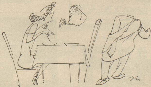
„Lass Dir Zeit, Fritz!“

Es fällt einem dort auf, daß die Leute nur sehr ungern in einen besetzten Bus einsteigen, auch wenn noch genügend Stehplatz ist. In einen vollen Bus steigt man nur ein, wenn man es sehr eilig hat oder wenn man von einem Platzregen überrascht wird. Sonst wartet man auf den nächsten. Der Kanarier kann warten. Er wartet eine Stunde, um zweihundert Meter weit zu fahren. Denn er geht nicht gern zu Fuß, und er fährt nicht gerne stehend. Bei einer Frau aber ist es geradezu eine Taktlosigkeit, wenn sie in ein besetztes Fahrzeug einsteigt. Denn da stellt sie die