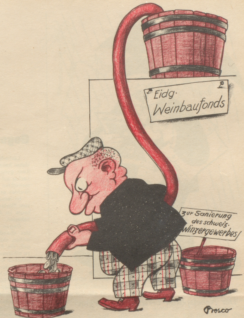
In Sachen Weinbaufonds

«Ich weiß es sehr wohl», sagte der Bewerber, «aber, keine Angst, von mir erfährt es kein Mensch.»