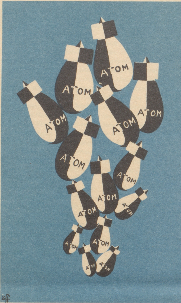
Die saure Traube