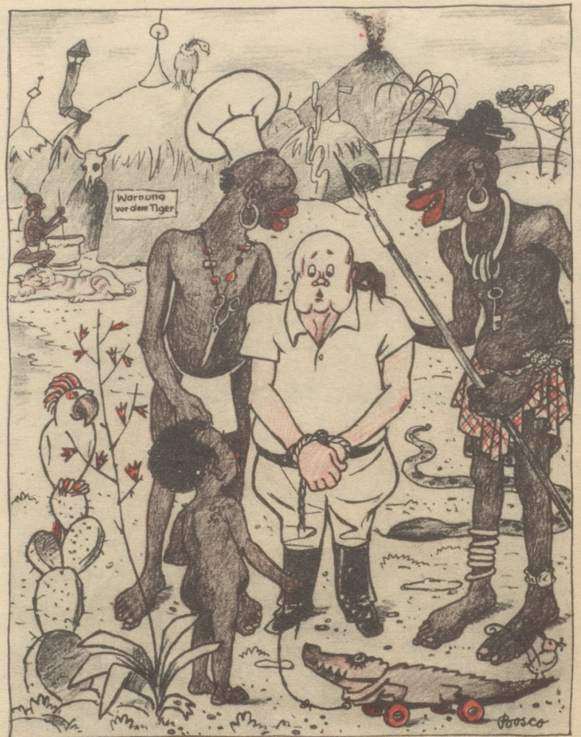
„Dasch en praktische, er isch scho grupft!“