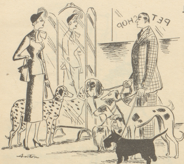
«Aber vielleicht paßt doch der Rotbraune besser zu meinem Kleid!» Copyright by Punch