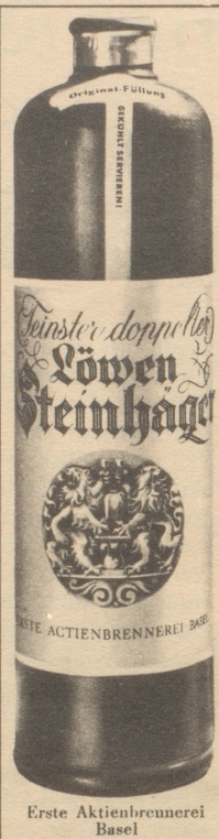
Erste Aktienbrennerei Basel

ERHÄLTICH IN COIFFEUR- UND PARFUMERIESALONS