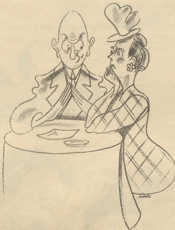
„Unglaublich, daß Hans mit Deiner Frau durchgebrannt ist; er war doch Dein bester Freund?“ „Das war er nicht, aber jetzt ist er es.“ Tyrhans