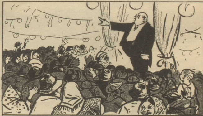
Der Volksredner: „Stoßt Euch nicht an meinem Bauch, den sollt Ihr alle auch bekommen — ich sage Euch — noch besser!“ Der Simpel