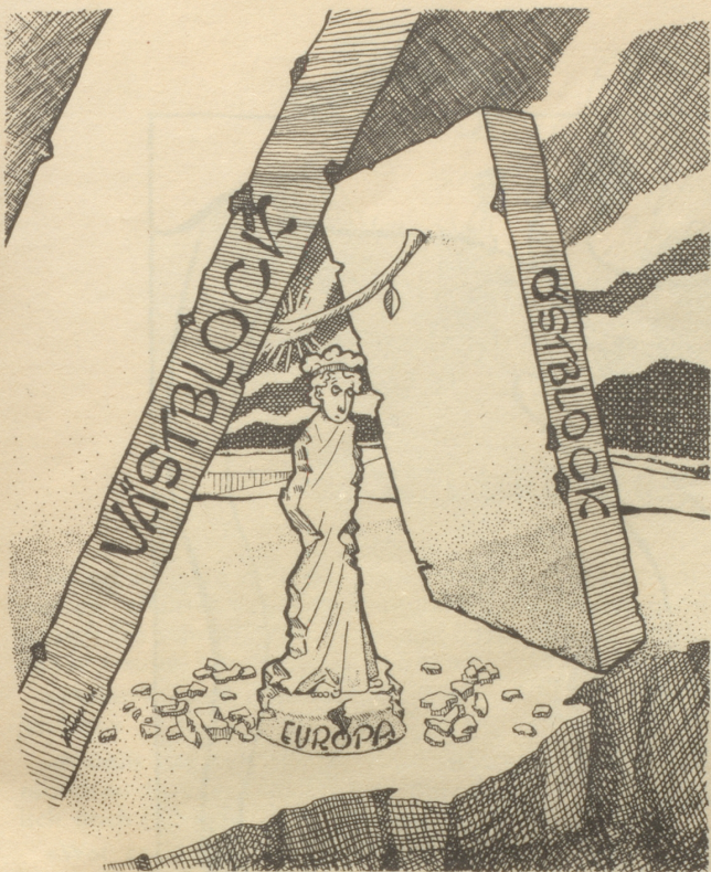
Hält er — — Söndagenisse-Strix