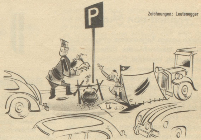
„Jä aber die Tafel bedüdet doch Parkplatz!“