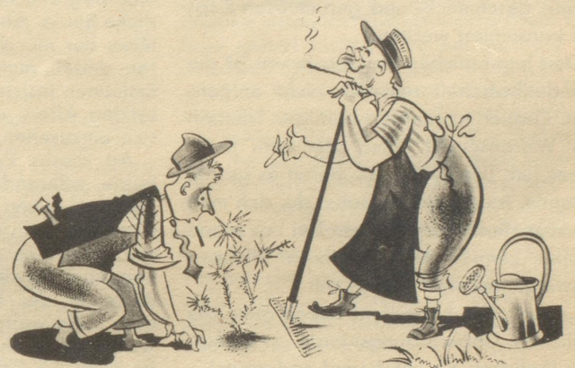
Gärtnerlateln Eisblumen, auch im Sommer!