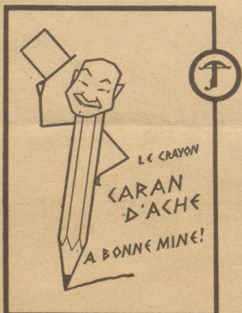
SCHWEIZERISCHE BLEISTIFFABRIK CARAN D'ACHE GENÈVE