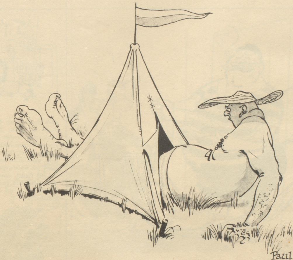
„An dem Zelt muß irgend etwas nicht stimmen!“