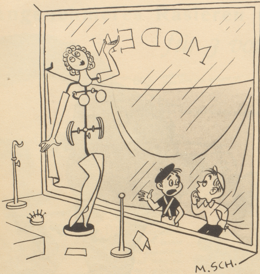
Hinter dem Vorhang — Also Schwindel — — I —