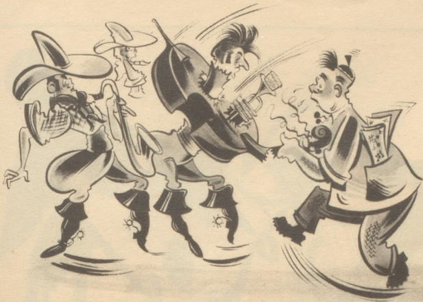
Die Schweizer Unterhaltungsmusiker müssen sich mit aller Kraft gegen exotische, manchmal wenig begabte Kapellen und Bands zur Wehr setzen.